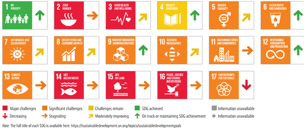
ภาพที่ 1 (ต่อ)