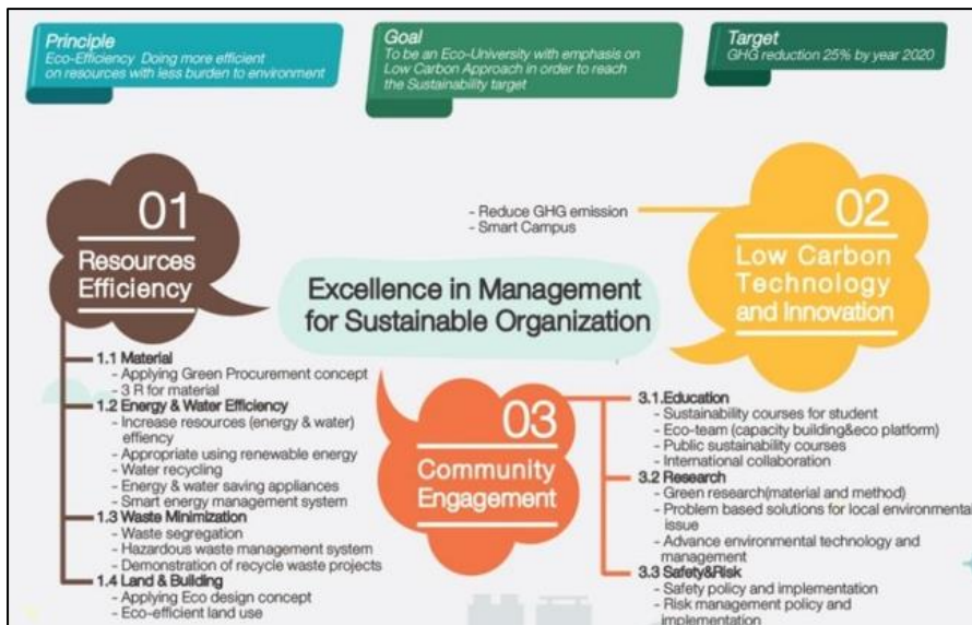
ภาพที่ 1 ตัวอย่างแผนผังของนโยบายที่มุ่งมั่นจะพัฒนาให้เป็นมหาวิทยาลัยที่เป็นมิตรกับสิ่งแวดล้อมอย่างยั่งยืน ที่มา: Mahidol Sustainable University

ด้วยมหาวิทยาลัยมหิดลมีนโยบายมุ่งที่จะพัฒนาให้เป็นมหาวิทยาลัยที่เป็นมิตรกับสิ่งแวดล้อม (Eco-University) ที่ใส่ใจต่อการพัฒนาสิ่งแวดล้อมและคุณภาพชีวิตที่ดีของนักศึกษาและบุคลากรมหาวิทยาลัยอย่างยั่งยืนโดยมุ่งเน้นให้เกิดแผนยุทธศาสตร์ที่ส่งเสริมการเพิ่มประสิทธิภาพการใช้ทรัพยากร (Resource Efficiency) ให้เป็นสังคมคาร์บอนต่ำ (Low Carbon Society) รวมทั้งส่งเสริมให้เกิดพันธกิจสัมพันธ์กับชุมชนในด้านสิ่งแวดล้อม (Community Engagement) เพื่อนำไปสู่การเป็นต้นแบบในการเป็นมหาวิทยาลัยที่เป็นมิตรกับสิ่งแวดล้อมแก่สถาบันการศึกษาแห่งอื่น ๆ ในประเทศไทย ดังสังเกตได้จากประกาศนโยบายของมหาวิทยาลัยมหิดล ลงวันที่ 25 สิงหาคม พ.ศ. 2564 ได้แก่ 1) นโยบายการประเมินผลกระทบต่อความหลากหลายทางชีวภาพจากการพัฒนาโครงการของมหาวิทยาลัย 2) นโยบายการปรับปรุงหรือก่อสร้างอาคารประหยัดพลังงาน 3) นโยบายการปล่อยก๊าซเรือนกระจกสุทธิเป็นศูนย์ (Net Zero Emission) 4) นโยบายการอนุรักษ์พื้นที่สีเขียว 5) นโยบายการอนุรักษ์และใช้ประโยชน์ความหลากหลายจากแหล่งน้ำ 6) นโยบายส่งเสริมการจัดซื้อจัดจ้างที่เป็นมิตรกับสิ่งแวดล้อม 7) นโยบายส่งเสริมการพัฒนาที่ทิ้งร้างหรือไม่มีการใช้ประโยชน์ 8) นโยบายส่งเสริมการลดใช้พลาสติกและงดใช้โฟม มหาวิทยาลัยมหิดล พ.ศ. 2564 9) นโยบายส่งเสริมการสัญจรที่เป็นมิตรกับสิ่งแวดล้อม มหาวิทยาลัยมหิดล 10) นโยบายส่งเสริมการอนุรักษ์พลังงาน 11) นโยบายส่งเสริมการอนุรักษ์และการใช้ประโยชน์ทรัพยากรธรรมชาติ 12) นโยบายส่งเสริมอนุรักษ์การใช้ประโยชน์ทรัพยากรจากมหาสมุทรอย่างยั่งยืน และ 13) นโยบายส่งเสริมอาหารเพื่อสุขภาพและปลอดภัย (คณะวิทยาศาสตร์, 2564)