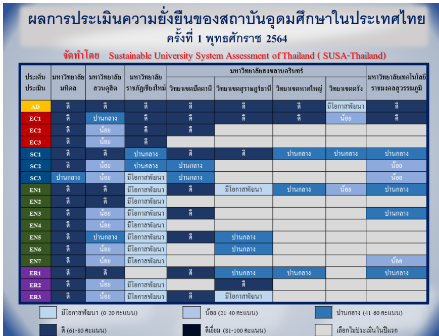
ภาพที่ 3 ผลการประเมินความยั่งยืนสถาบันอุดมศึกษาไทย ประจำปี พ.ศ. 2564